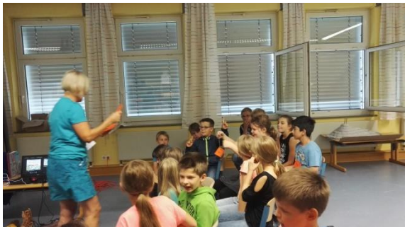
Rollen werden verteilt.

Eindrucksvoll baute sie ein Theaterstück von den Kindern inszeniert in eine informative Powerpoint präsentation ein.